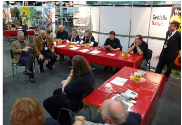
Morgentliche Lagebesprechung und Andacht

Ein Beispiel für viele, die dies miterlebt haben: Am Freitagabend gegen 20.30 Uhr kam eine Frau, die am Vormittag ihre Tests gemacht hatte, an den DVG Stand und rief überrascht: „Wo sind sie denn alle? Ist keiner mehr da? Ich hätte doch gerne meine Ergebnisse gehört.“ Sie bekam zu Antwort: „Wir feiern Sabbat. Die Helfer haben Sabbatpause und sitzen im Kongress-Plenum!“ „Sabbat? – Sie wollen mich wohl auf den Arm nehmen? – Was ist das denn?“ entgegnete sie. Sie kam an den Nimm Jesus Stand und es entwickelte sich ein sehr positives Gespräch über den Sabbat, das Bibelverständnis der Siebentags-Adventisten und den persönlichen Glauben. Adressen wurden ausgetauscht und wir erhielten einige Tage später eine Nachricht mit folgendem Inhalt: „Schön, von Ihnen zu hören. Nochmals ein großes Dankeschön für die wunderbaren Gespräche mit Ihnen in Düsseldorf. Toll, dass ich Sie kennenlernen durfte. Ich habe mir zum Ziel gesetzt, die Bibel im Ganzen erneut zu lesen und zu studieren und bereits damit begonnen, das NT zu lesen. Einen Bibelleseplan nutze ich auch und mit dem Johannesevangelium habe ich gestartet.“