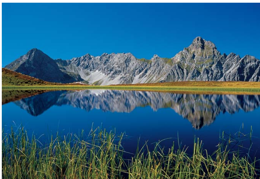
421 Zimba und Saulakopf

Kennen Sie das Rezept gegen Gelenkprobleme, Muskelschmerzen, Verspannungen, Leistungsmangel, Kurzatmigkeit, Stress, Depression, Burnout, Übergewicht, Diabetes, Bluthochdruck?